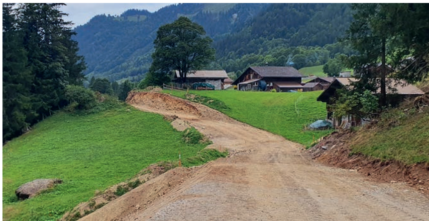
Trassee Bereich Gröoben im Rohbau