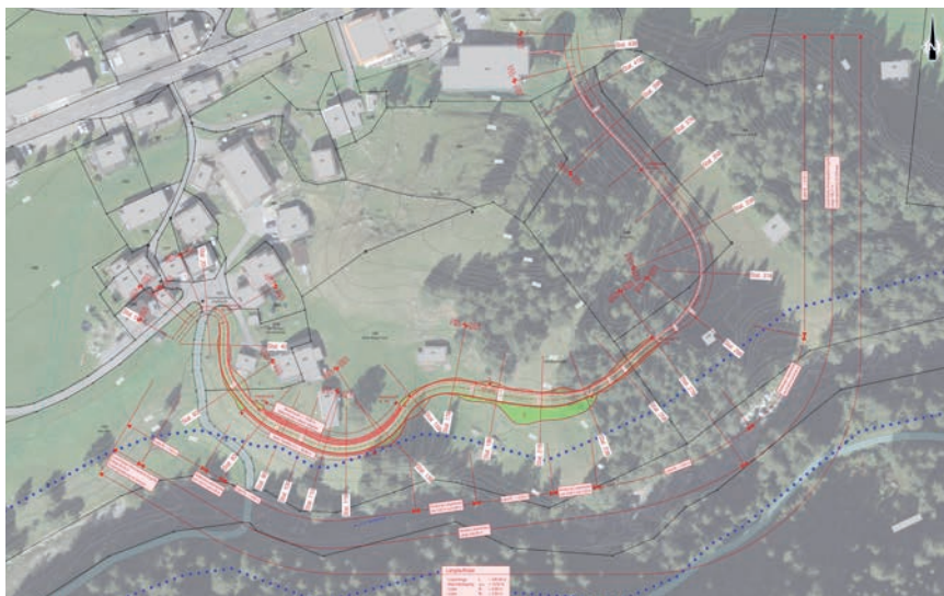
Situationsplan mit neuer Linienführung (rot) [Mätzener & Wyss Bauingenieure AG]

Nach der Ausfahrt aus dem Wald wird die Loipe 6 m breit und führt nun auf einer Dammschüttung durch die Gröoben. Es folgt ein kurzer, moderater Aufstieg und nach einer Rechtskurve geht es direkt in die Traverse des Steilhangs. Um hier überhaupt die Präparation einer Loipe zu ermöglichen, hat man bis zu 4 m hohe Stützmauern errichtet. Nach dem Steilhang führt die Loipe in einer leichten Hanglage bis zum Platz unten in der Mühleschlucht und quert das Bäuertsträsschen. Dieses ist im Winter geschlossen und wurde in der Vergangenheit vom NSCO schon mehrmals als Verbindung nach Schattseiten genutzt. Vom Mühleschluchtplatz aus verläuft die Strecke dann parallel zur Gemeindestrasse und mündet bei der PistenBully Garage wieder in die altbekannte Loipe.