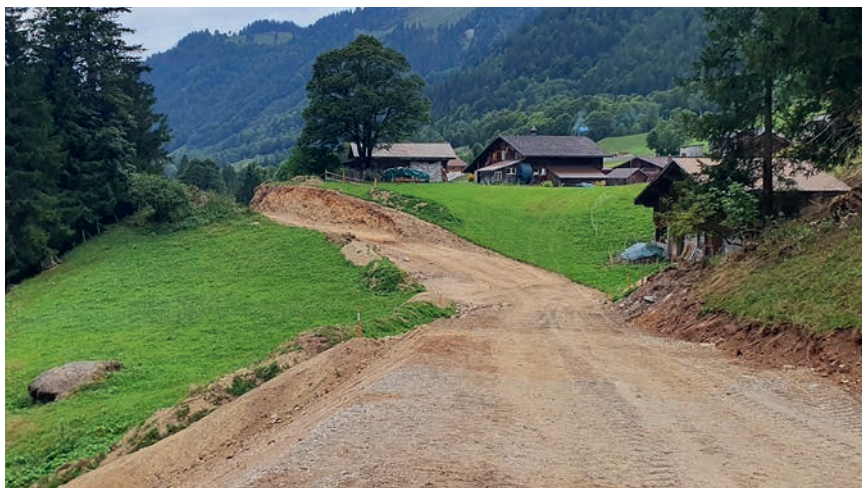
Trassee Bereich Gröoben im Rohbau

Die übrigen Abschnitte ausserhalb des Steilhangs waren wesentlich einfacher und schneller gebaut. Auf der Wiese musste zuerst der Humus abgetragen und seitlich zwischendeponiert werden. Danach erfolgte der eigentliche Trasseebau. Das trockene Wetter Ende Juli/Anfang August war für die Erdarbeiten ideal. Für die nötigen Schüttungen wurde vor Ort angefallenes, überschüssiges Aushubmaterial verwendet. Bei den Geländeeinschnitten kam vereinzelt etwas Fels zum Vorschein, welcher mittels Spitzhammer am Bagger abgetragen wurde.