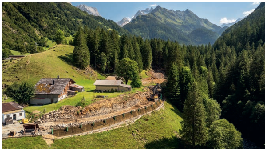
Baustelle mit Blick taleinwärts

Auch die Bauarbeiten sind aktuell noch nicht abgeschlossen. Sie sind aber auf Kurs und der neue Streckenteil wird für den Saisonbeginn bereit sein. Mich persönlich freut es speziell, dass ich die Umsetzung dieses Projekts begleiten durfte. Schliesst sich doch so ein Kreis, welcher mit den ersten Projektideen vor über zehn Jahren begonnen hat.